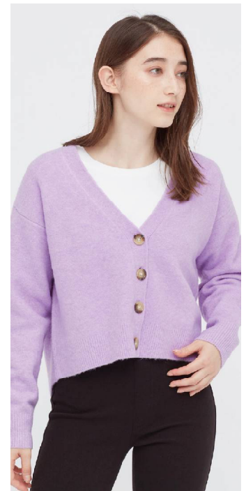
WOMEN SOFT SOUFFLÉ YARN V NECK CROPPED CARDIGAN