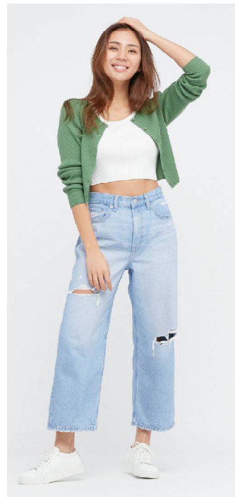
WOMEN'S LOOSE CROPPED JEANS (DAMAGED)